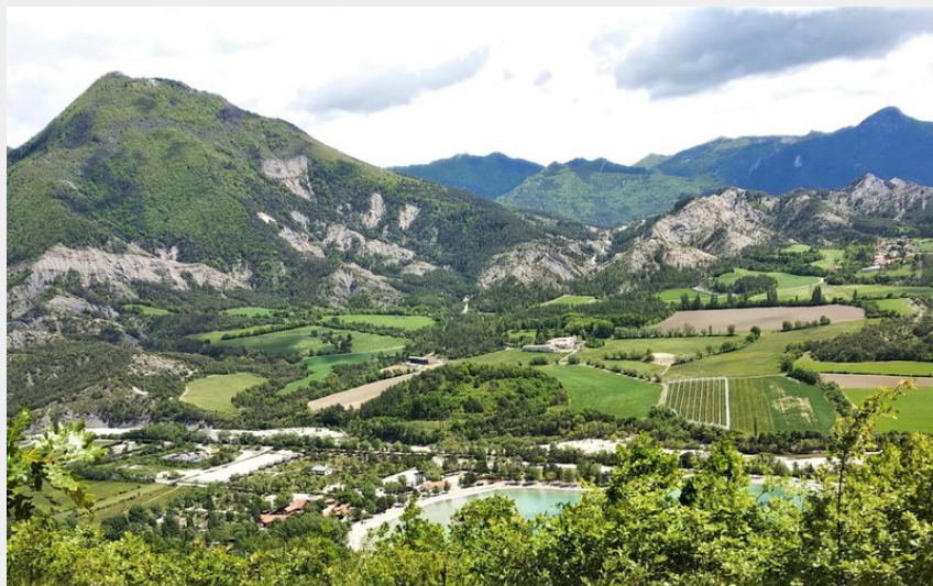
Le plan d'eau et le val d'Oze vus de l'Eygau