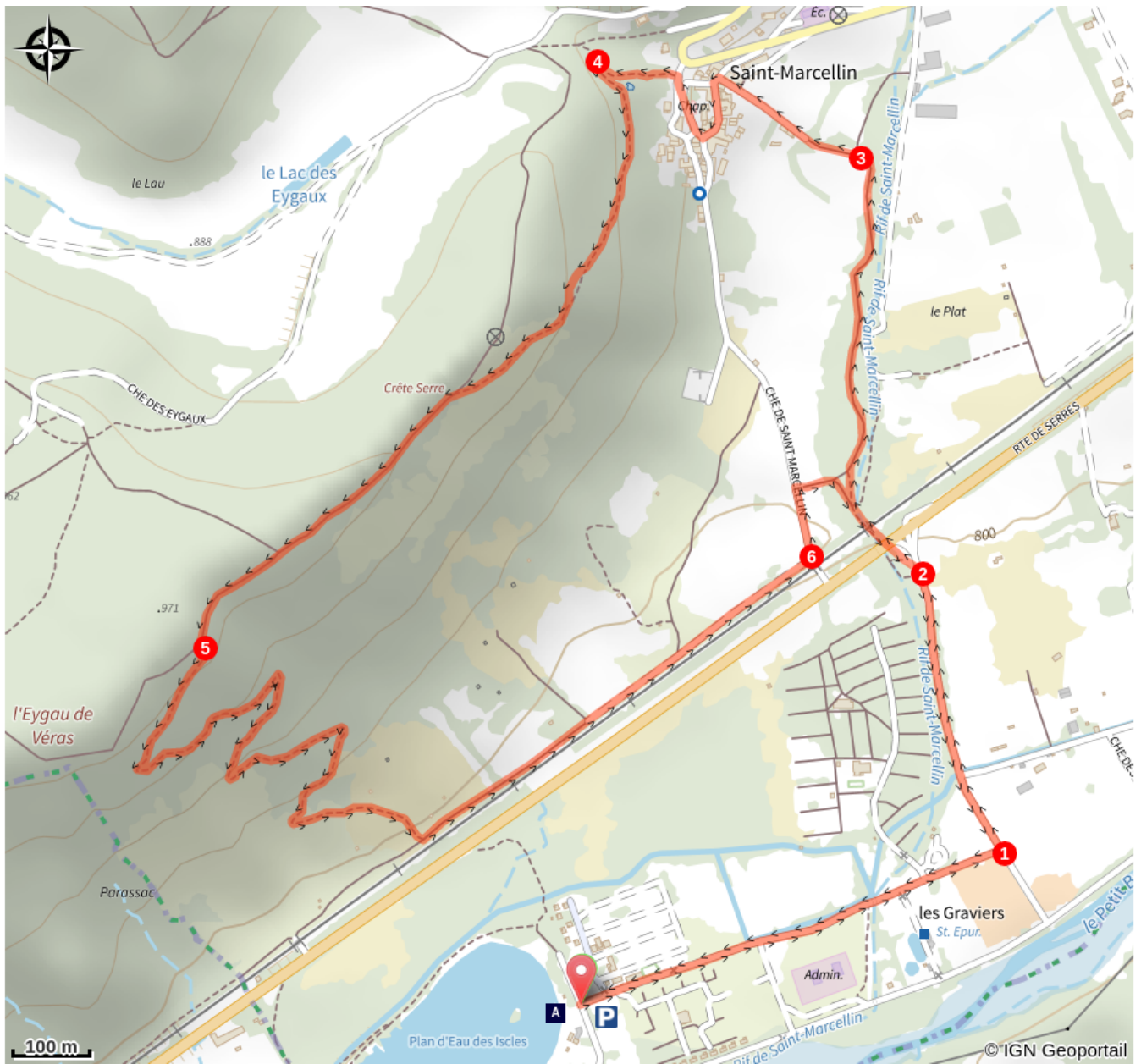
Plan d'eau des Iscles (A)